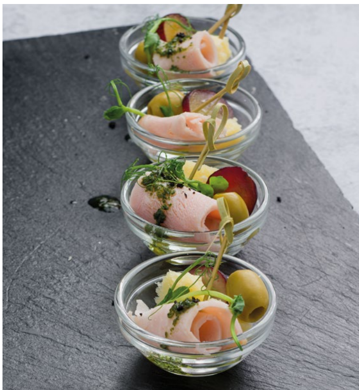
КАНАПЕ С СЫРОМ ПАРМЕЗАН, КАРБОНАДОМ И МАСЛИНОЙ