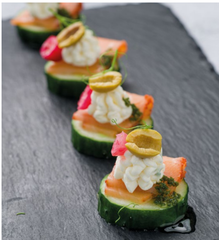
КАНАПЕ С СЕМГОЙ И СВЕЖИМ ОГУРЦОМ