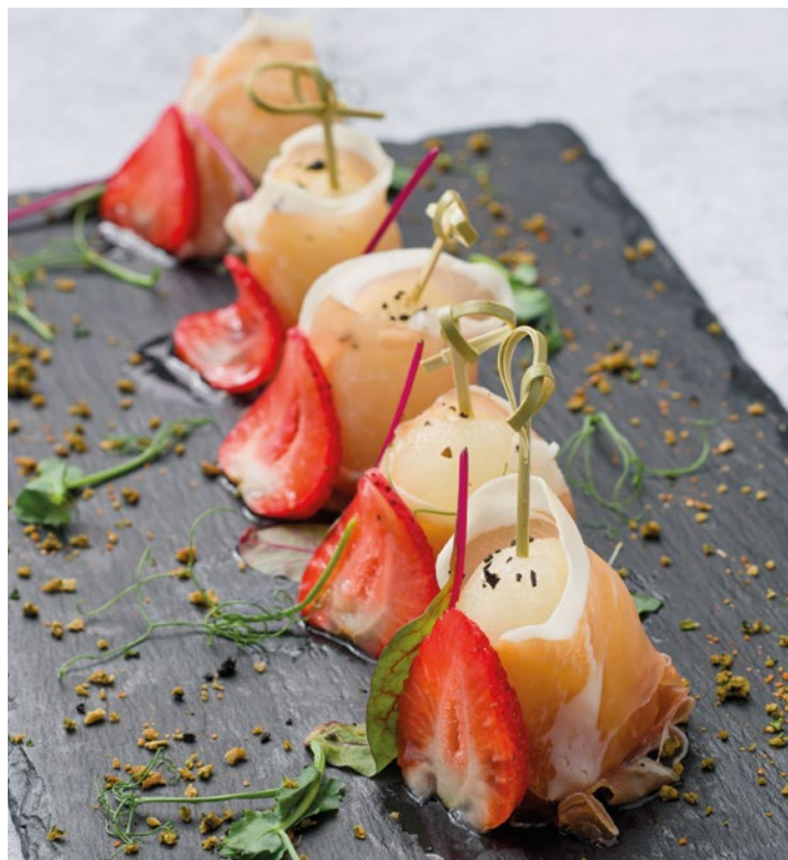
КАНАПЕ С ПАРМСКОЙ ВЕТЧИНОЙ И ДЫНЕЙ